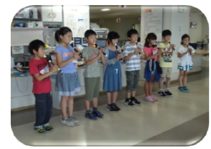
笛の合奏のプレゼント♪

午前中だけの短い時間でしたが、小学生の皆さんの目に「老人保健施設」がどのように映ったのでしょうか？感想を聞くのが楽しみです。