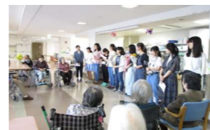
綺麗な歌声に和みます

「花の日の訪問」で、保育園児、教会の児童、同志社高校と同志社女子高校の学生がお花を持ってきてくれました。かわいいお客様ときれいなお花、そして歌のプレゼントに皆さま大変喜んでおられました。