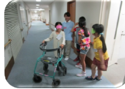
目隠しをして高齢者の疑似体験