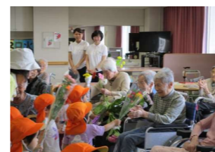
園児からのプレゼントに自然と笑みがこぼれます