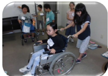
職員から使い方の説明をし、実際に車イスや歩行器を使ってみました