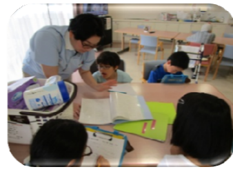
感染防止に使用している物品の説明