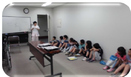
嚙下についての説明

北白川小学校の生徒さん、約50名が6月28日、29日の2日に分かれて職場体験に来られました。6月7日に事前にオリエンテーションを行い、当日は4,5人のグループに分かれて通所リハビリや療養棟の見学や車イスの操作などを体験して頂きました。