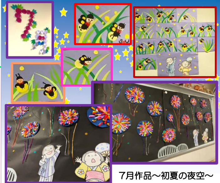
7月作品～初夏の夜空～

今年は梅雨入りが早く、昭和26年に始まった梅雨統計上、1番と言える程、長い梅雨となりました。さらに、この夏はチベット高気圧と太平洋高気圧の“ダブル高気圧”がタックを組み猛暑となる予想です。この2つの高気圧は、広がる高度が異なる為、上空で重なり合い厳しい暑さをもたらすそうです。猛暑の夏を元気に乗り切る為に、①こまめな水分補給②十分な休息③エアコンなど空調の適切な使用を行ない暑さに負けず過ごしていきましょう。