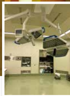
図1:無影灯の設置の様子